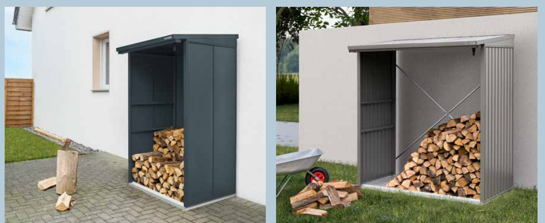
Supports à bois de chauffage Berry – deux motifs et une multitude d'exécutions possibles