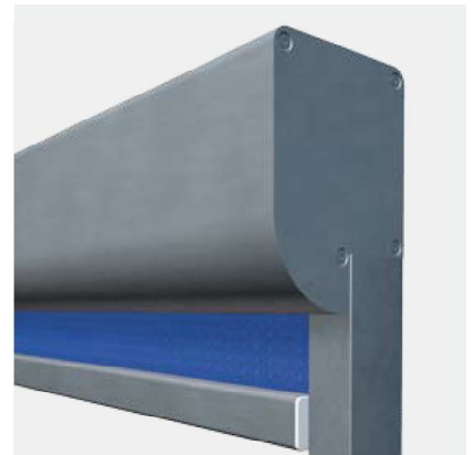
Élégant et fonctionnel: cassette de protection élégante en aluminium.