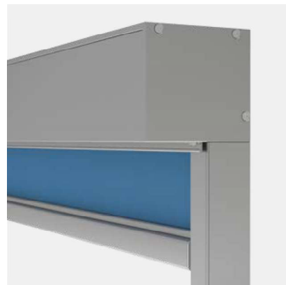
Beau et pratique: caisson de protection élégant avec couvercle de service.